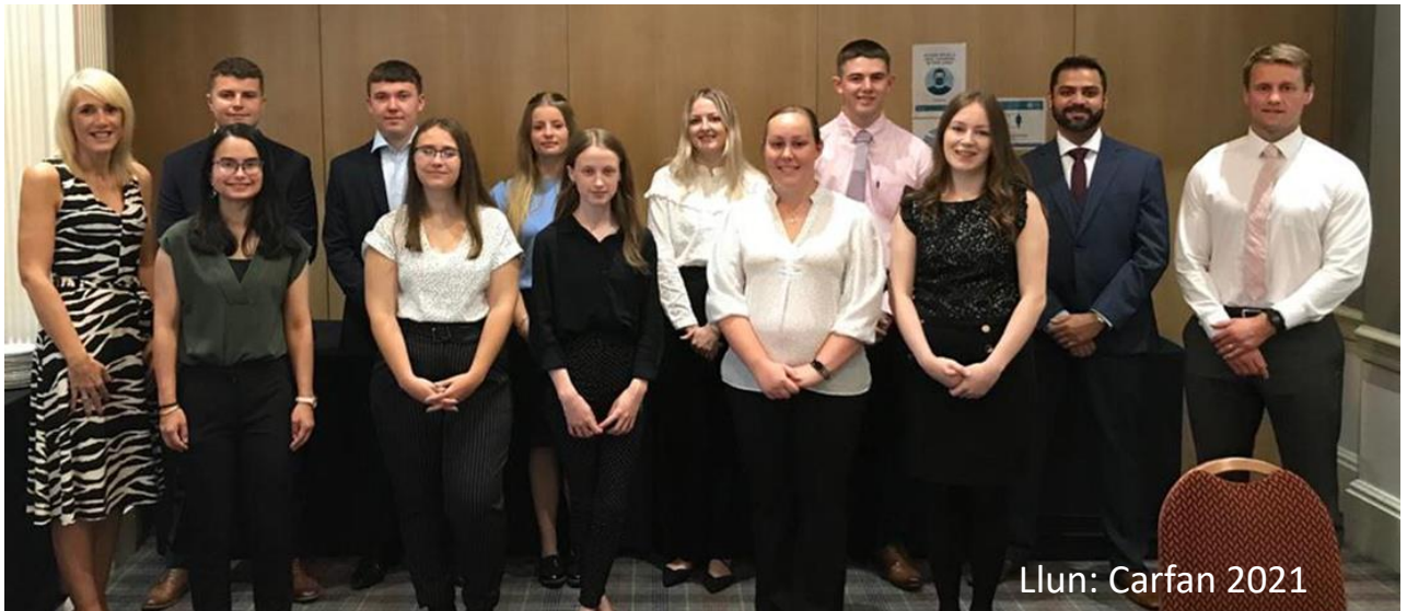
Llun: Carfan 2021

Wrth wraidd y rhaglen Prentisiaethau, mae creu profiad carfan gyda chydweithwyr o bob rhan o Gyllid GIG Cymru. Mae ein Carfan gyntaf i'w gweld isod ac maent wedi dechrau'r Rhaglen Prentisiaethau ym mis Medi 2021: